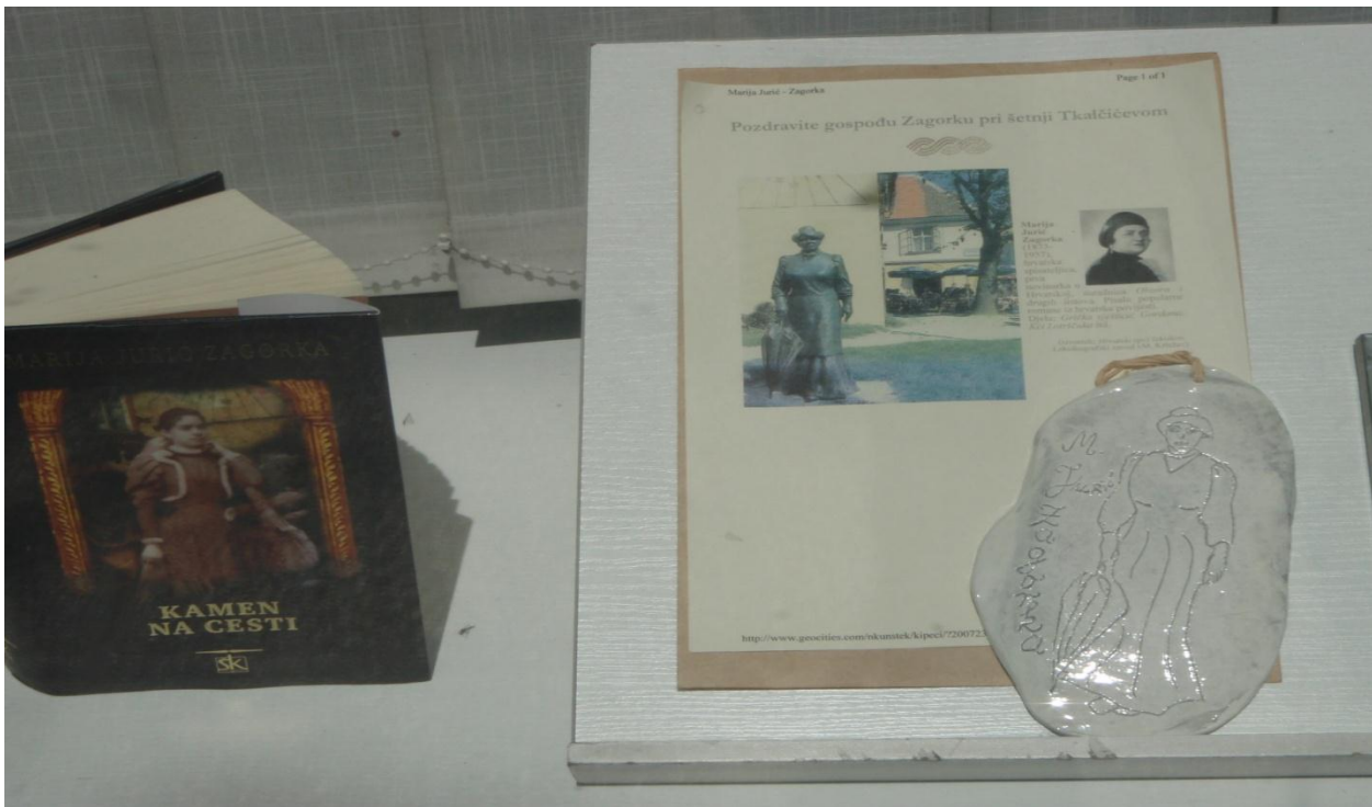
Pozdravite gospođu Zagorku pri šetnji Tkalčičevom